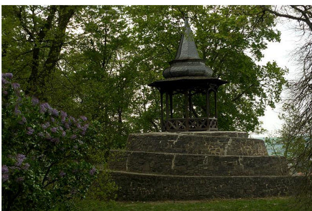
Der Schneckenturm und der 175 Jahre alte Wartturm im Schillerhain nahe des Startpunktes.

Die Altstadt von Kirchheim-Bolandern und die Burg sind sehenswert und lohnen einen Besuch!