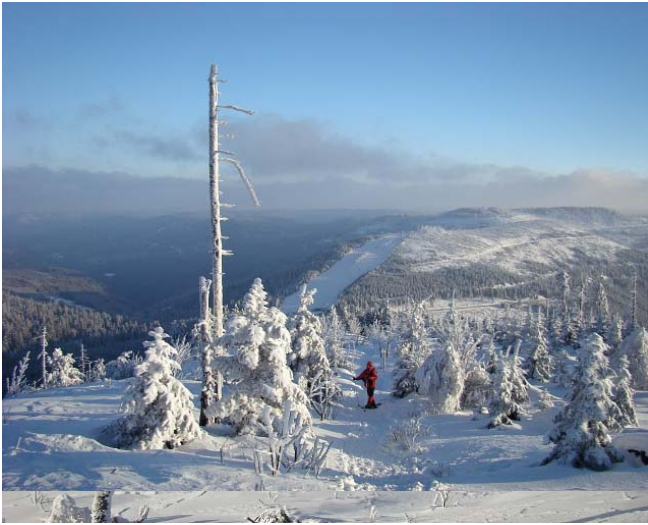
© Gerald Friederici 2008 Nachdruck nur nach Rückfrage und Erlaubnis